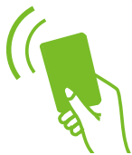
Система контроля доступа

Новый турникет-трипод с компактной конструкцией, позволяющей уменьшить занимаемую площадь, весь корпус изготовлен из нержавеющей стали и является долговечным. Интегрирован со световым индикатором входа на видном месте для направления прохода. Турникет автоматически опускает планку при возникновении чрезвычайных ситуаций.